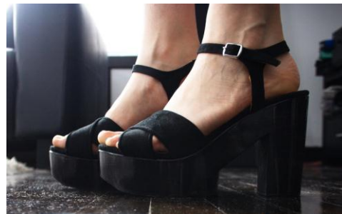
Sandals/Sandales: ZARA (click here to buy it)

These sandals are VERY comfortable because even if the heels are really high, the platform prevent the feet to be to distorted.