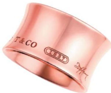
▶ Tiffany 1837 RUBEDO™ 環扣吊墜，$1,400。

查詢： Tiffany & Co. www.tiffany.com 1-800-265-1251